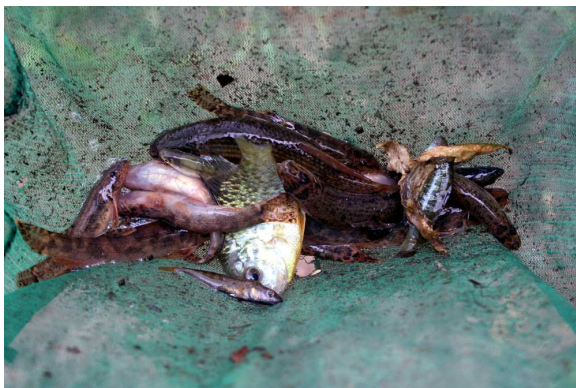
Bermpjes, grondel en zonnebaars