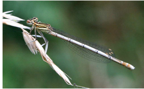
Blauwe breedscheenjuffer (vr)