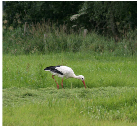
en ... in het aanpalende weiland een Europese oievaar

De meetpunten, behalve 4 met Asdonckbeek en Brisdilloop, leverde geen of beperkte vangsten op. Dankzij het goede weer, de Europese oievaar en enkele mooie vissen al bij al toch een fijne visdag!