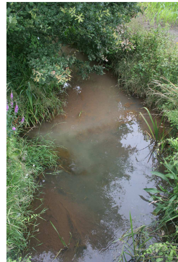
Monding Brisdilloop in Asdonckbeek