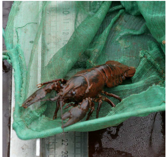
een (waarschijnlijk) Amerikaanse rivierkreeft