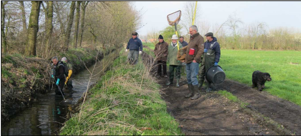
Karpers van traject 1 – aanvoersloot andere vloeiweide